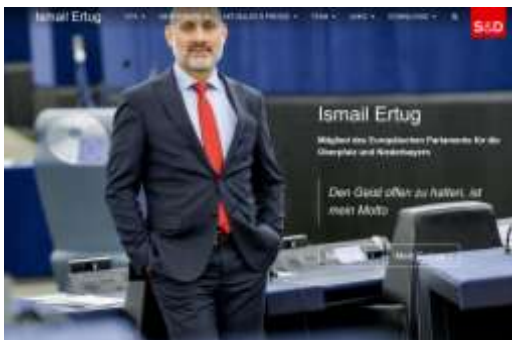
Ismail Ertug, SPD (Fraktion S&D)