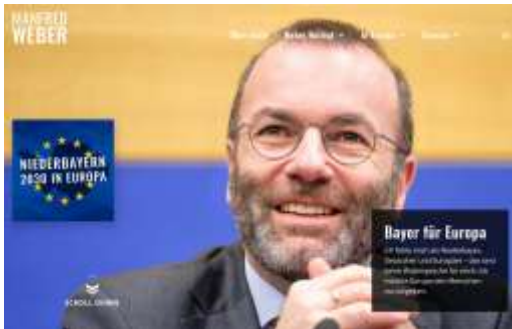
Manfred Weber, CSU (Fraktion der EVP),